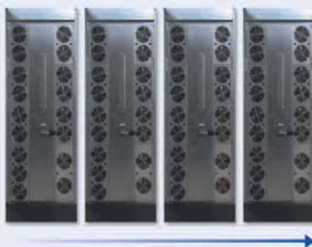
Modularidad horizontal convencional: SAI en paralelo

La modularidad horizontal: se refiere a la opción de aumentar la potencia total del sistema añadiendo módulos SAI adicionales a un sistema existente para aumentar la potencia o la redundancia. La modularidad horizontal permite que el usuario realice una inversión inicial adaptada a sus necesidades de carga inmediatas (a corto plazo) y, después, aumente la potencia del sistema a medida que las necesidades de su negocio crezcan.