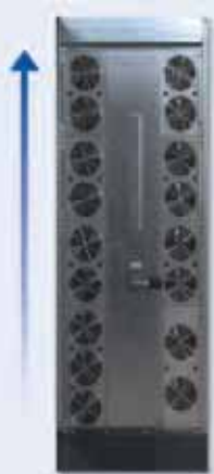
Vista interna del SAI con subgrupos

La modularidad vertical: se refiere a la estructura interna del SAI en el que las partes de un componente se configuran como subgrupos extraíbles dentro del armario del SAI. Esto mejora la flexibilidad y la capacidad de servicio del SAI y así, reduce el tiempo que se necesita para el servicio, la reparación (MTTR o tiempo medio de reparación reducido al mínimo) y el mantenimiento.